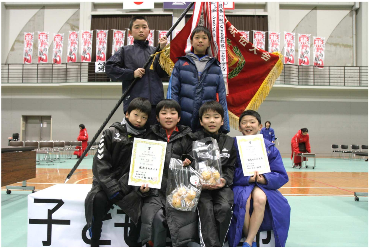
2020年度 第47回熊野駅伝大会【子ども会の部】優勝チーム 萩原子ども会